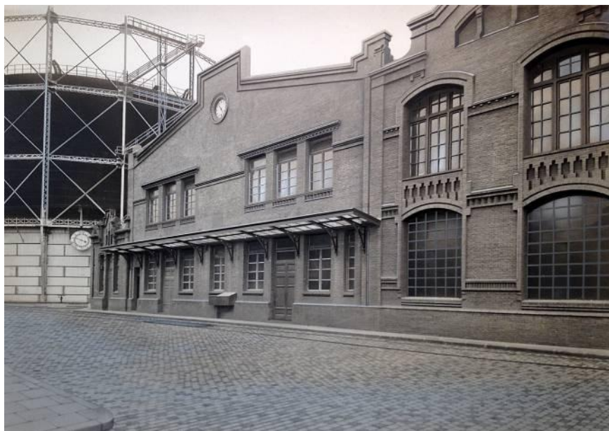
Fachada del edifici de los Laboratorios de análisis y Servicios médicos de la fábrica de la Barceloneta. Original que forma parte del trabajo del Álbum del 1947. 20,4 x 29 cm | AHFGNF