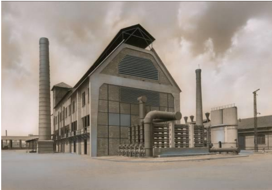
Edificio de Hornos y refrigeración de la fábrica de Sant Martí (Barcelona). Original que forma parte del trabajo del Álbum del 1947. 20,4 x 29 cm