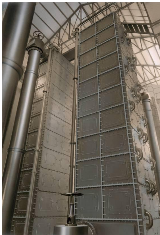
Refrigerantes del gas Reutter de la fábrica de la Barceloneta. Original que forma parte del trabajo del Álbum del 1947. 29,8 x 20,5 cm