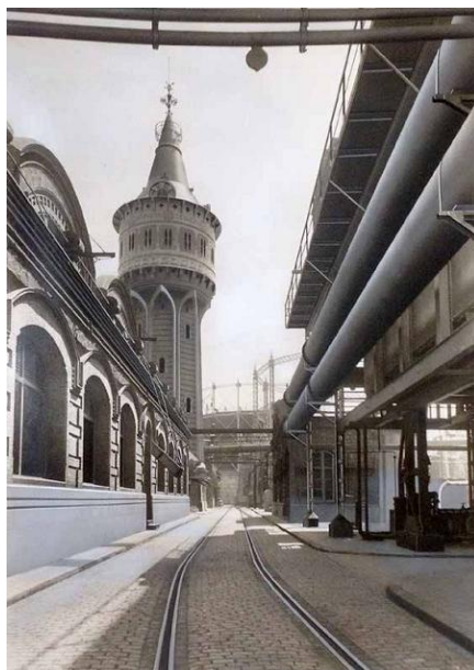
Calle de la fábrica de la Barceloneta (Barcelona). A la izquierda, la sala para regenerar el óxido de Hierro para purificar el gas. A continuación, la torre de aguas (que tenía diferentes niveles, con depósitos de alquitrán, Aguas amoniacales y agua dulce). Al fondo, los gasómetros. Copia original retocada a mano. 39,8 x 29,8 cm; 29,5 x 21 cm | AHFGNF