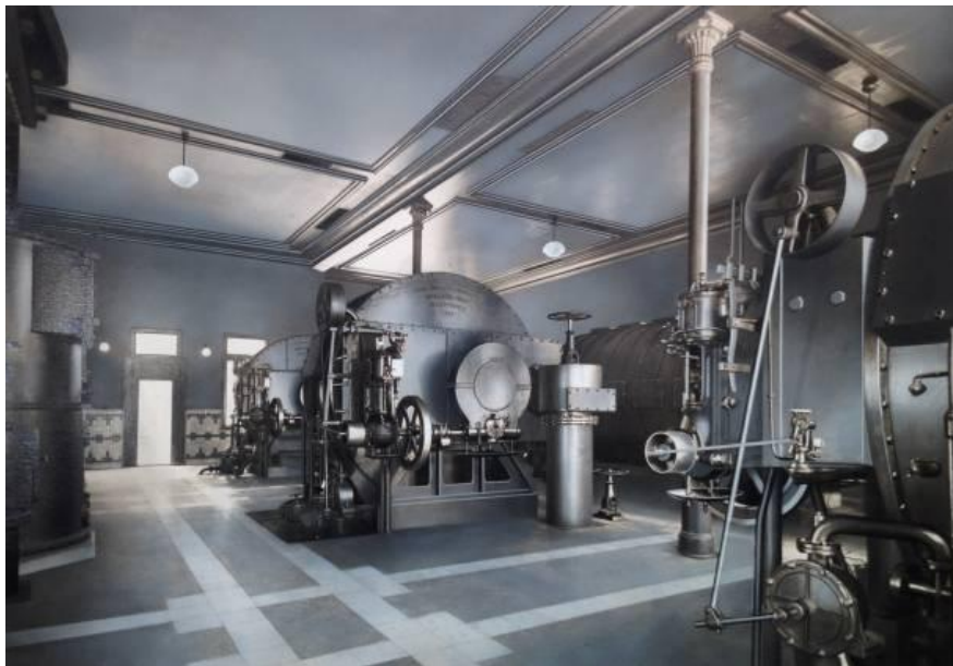
Instalación Antigua de la depuración química del gas de la fábrica de la Barceloneta. Lavadoras rotativas de naftalina. Original que forma parte del trabajo del Álbum del 1947. 20,6 x 29 cm