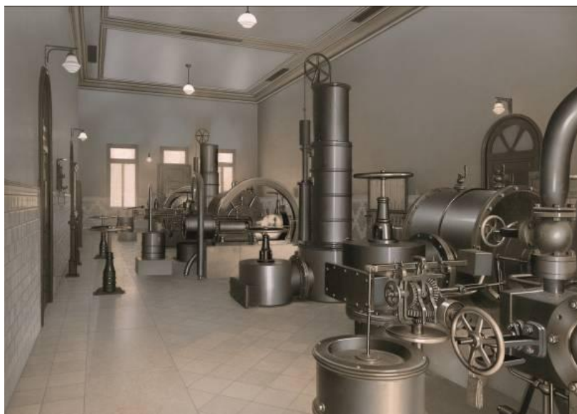
Sala de máquinas con extractores que aspiran el gas de los refrigerantes y dan la presión necesaria para que circule por los aparatos y se llenen los gasómetros. Original que forma parte del trabajo del Álbum del 1947. 20,3 x 29 cm