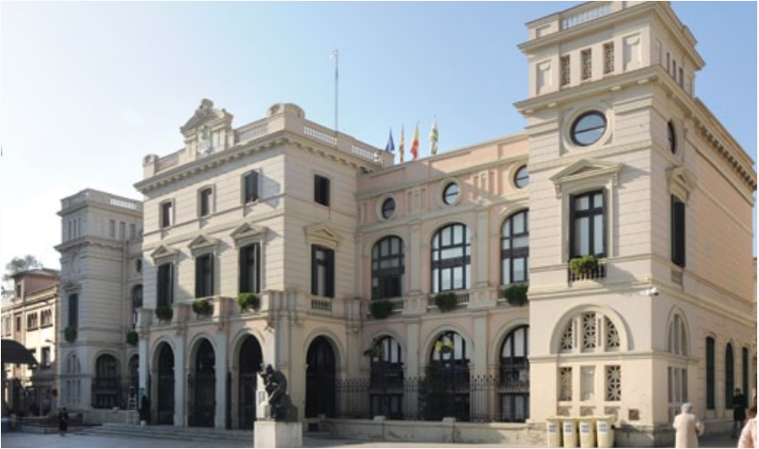
3 Ayuntamiento de Sabadell. Fachada posterior, 1900 Plaça del Dr. Robert