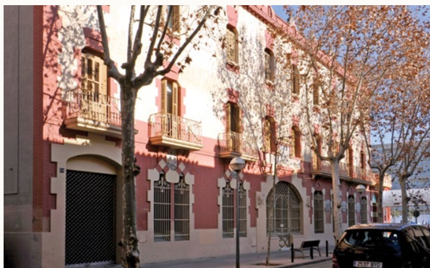
6 Hotel Suís, 1902 Carrer de la Indústria, 55-57