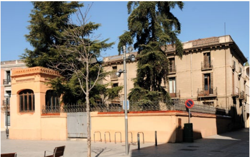
2 Casa José Marçet Font / Casa Grau, 1903 Plaça del Gas