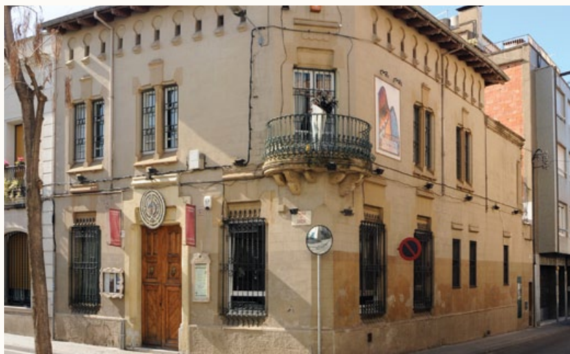
8 Casa Bru - Miralles, 1893 Carrer de Gràcia, 129-131