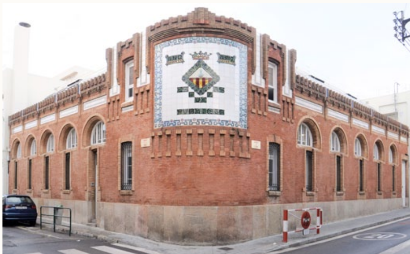
7 Escuelas Públicas (Escola Enric Casassas), 1897 Carrer de Llobet, 79