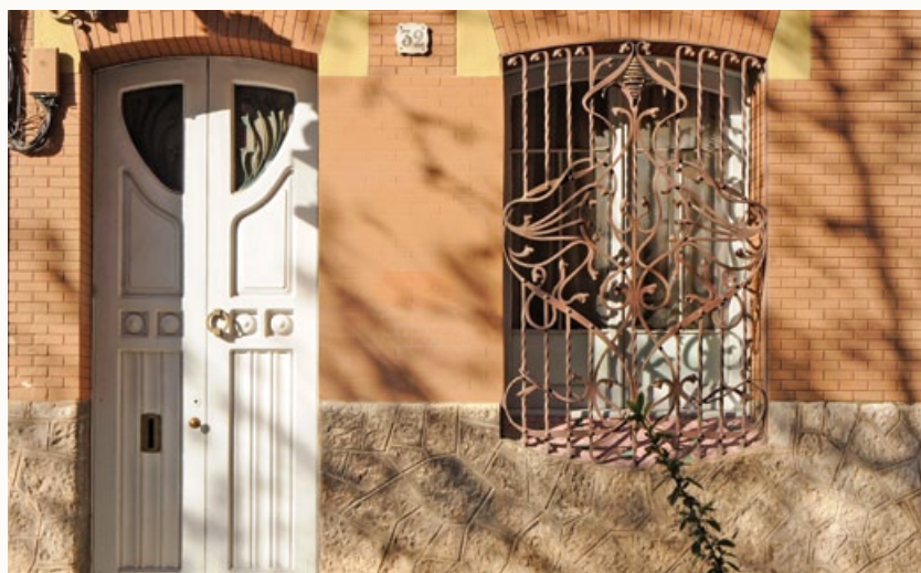
10 Casa Tort / Prats / Torrens / Turull Comadran, 1910 Carrer d'en Font, 32