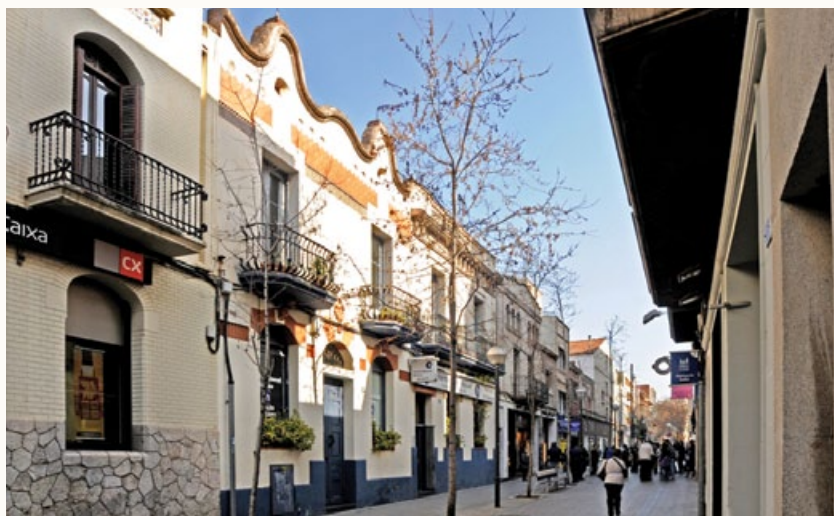
9 Casas de Rosa Manent Camps, 1904 Carrer de l'Escola Industrial, 14-18