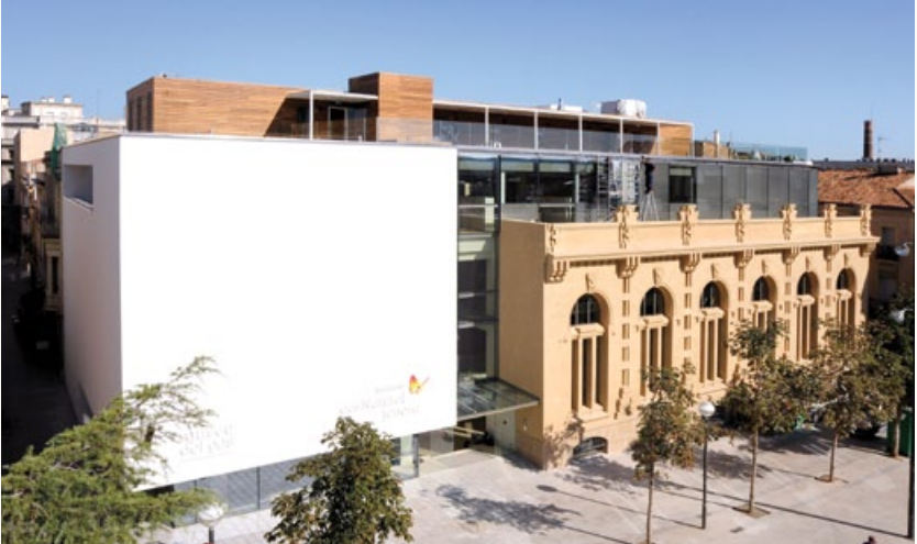
1 Museo del Gas. Edificio de La Energía , 1899 Plaça del Gas, 8