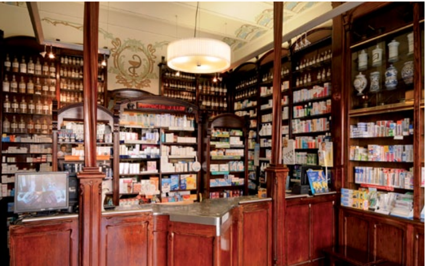
4 Farmacia La Barcelonesa (actual Farmacia Llop), 1902 Passeig de la Plaça Major, 58